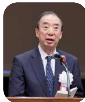
清家会長による挨拶

全社協 清家 篤 会長は、主催者挨拶において今後10年間の福祉関係者共通の取り組み方針として全社協が策定した「全社協 福祉ビジョン 2020」と軌を一にして全民児連が策定した「地域共生社会の実現に向けた民生委員・児童委員、民児協としての行動方針」(令和4年3月)にふれ、今後も社協と民生委員・児童委員が車の両輪となって、地域における福祉活動をけん引していけるよう、参加者に協力を要請しました。