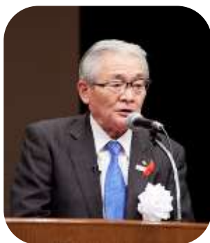
得能会長による式辞

全国民生委員児童委員大会は、台風や新型コロナウイルス感染症の影響により中止や参加者限定での開催が続いていましたが、最大限の感染対策を講じることで、全国から約2,600名が集っての開催となりました。