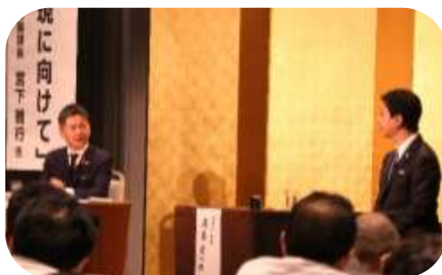
記念対談のようす (左:梅野会長、右:高島市長)

初日の梅野会長と福岡市 高島 宗一郎 市長による記念対談「未来について語る～2040 年の都市と福祉～」では、下支えのイメージが強いこれまでの福祉から脱却し、成長戦略へ押し上げていく意識をもつことや、少子高齢化が進行するなかで各地域で最適な福祉を提供していくために若い世代が中心となって次の時代に向けたアプローチを実践していくことの必要性等について意見を交わしました。