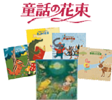
毎年まとめられる「童話の花束」

JOMO奨学助成は、JOMOグループが毎年実施の「JOMO童話賞」入賞作品を、「童話の花束」という本にまとめ、全国のグループ各社・グループ社員のみなさんが本を購入した浄財を、本会に寄付されて実施しています。