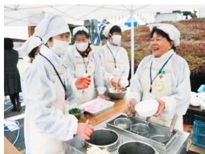
ボランティアフェスタでの活動