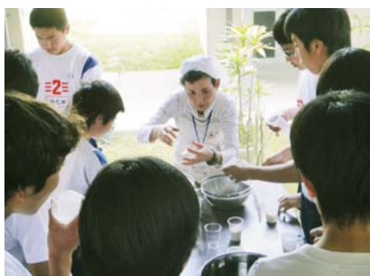
中学校での炊き出し訓練

自治会や地域の団体・グループなどからの、救急法や炊き出しなどの講習要請に基づき、一緒に非常食炊き出しなどを行っています。また、災害が起きた時すぐ活動できるよう、防災訓練などにて炊き出し訓練を行っています。