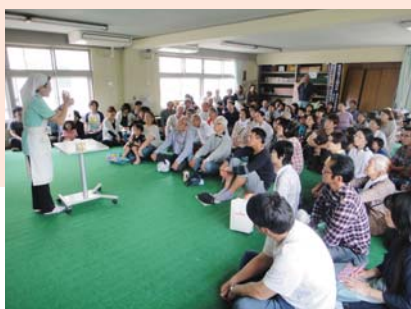
自治会の防災訓練への参加