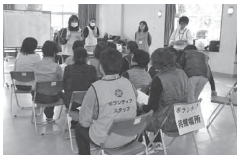
運営訓練でのマッチングの状況

災害ボラセン訓練は、東日本大震災被災地の福島県いわき市に派遣した社協職員が現地から学んだことを含めて、ボランティアを迎える側の対応能力の向上を目的にしたものです。