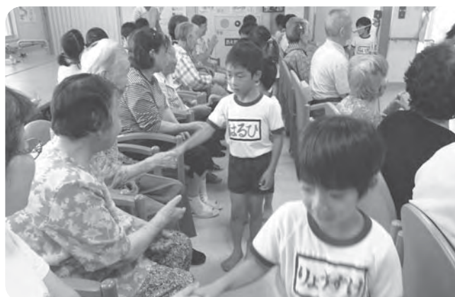
保育所との交流会