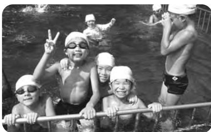
夏はプールが一番!(てるはの森の宿)