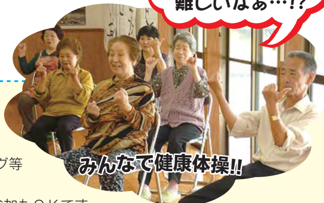
みんなで健康体操!!