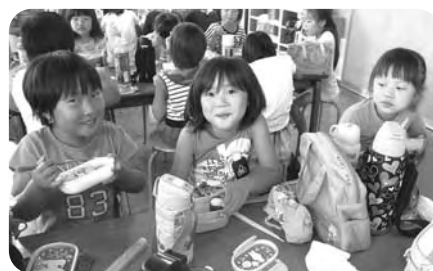
楽しいお弁当の時間です