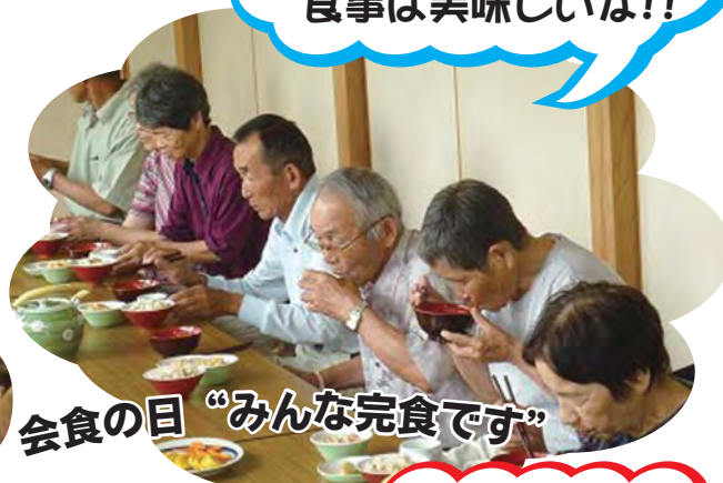
会食の目“みんな完食です”