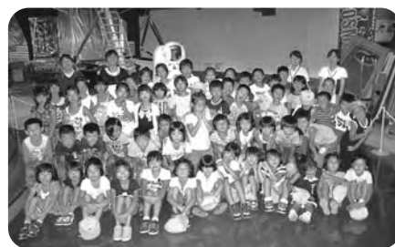
夏休み遠足(宮崎科学技術館)