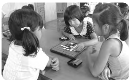
真剣です!(オセロ大会)