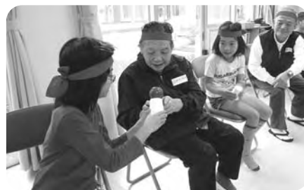
ケアハウスとの交流会(ミニ運動会)