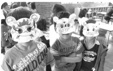
3D面作り(児童館まつり)