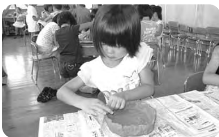
仕上がりが楽しみです(陶芸教室)