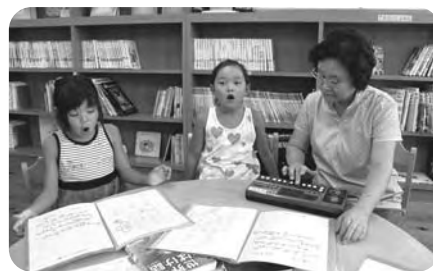
岳岑会の詩吟教室(毎週土)