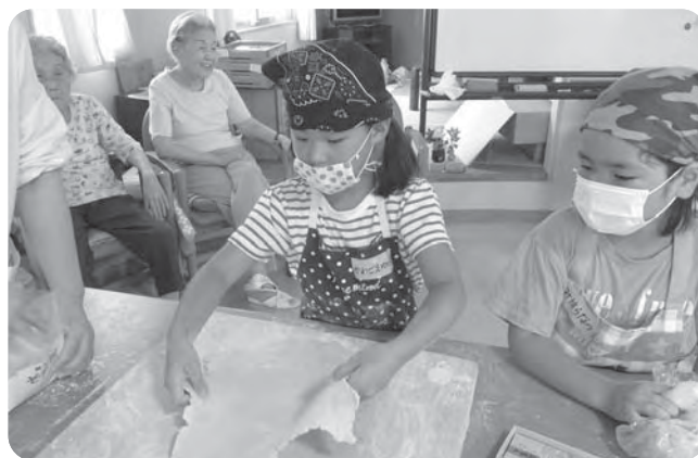
児童館との交流会(そば打ち)