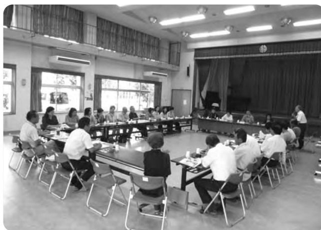
鹿児島県東串良町民生委員児童委員20名が 来町され意見交換を行いました。