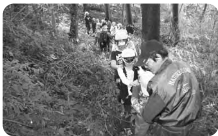
自然体験活動(ネイチャーゲーム)