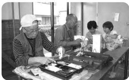
おもちゃ病院(偶数月第3土)

綾町児童館は、児童に健全な遊びを与えて、その健康を増進し、または、情操を豊かにすることを目的として、平成11年4月1日開館、15年目を迎えています。綾小中学校より徒歩で数分、中央ふれあい公園に隣接と環境にも恵まれ、小学生を中心に、一日平均70名、年間延べ1万9千人程の利用があり異学年交流の場にもなっています。館内には遊戯室、集会室、図書室、調理室、児童クラブ室があり、全ての児童が気軽に利用でき、サッカー、野球、一輪車、ドッジボールなどいろいろな遊びや、オセロ大会、プラバン工作などの行事、各施設・団体との交流会等、さまざまな体験ができる「遊びの広場」です。利用は原則として無料です。夏休み等は児童館・児童クラブとも午前8時から午後6時まで開館(開設)しています。