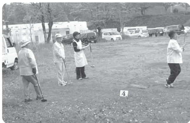
グラウンドゴルフ交流会(立町)