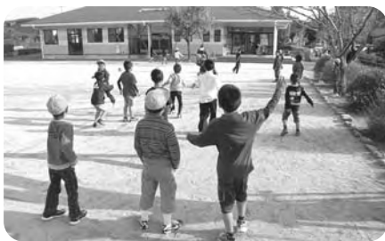
児童館は遊びの広場です