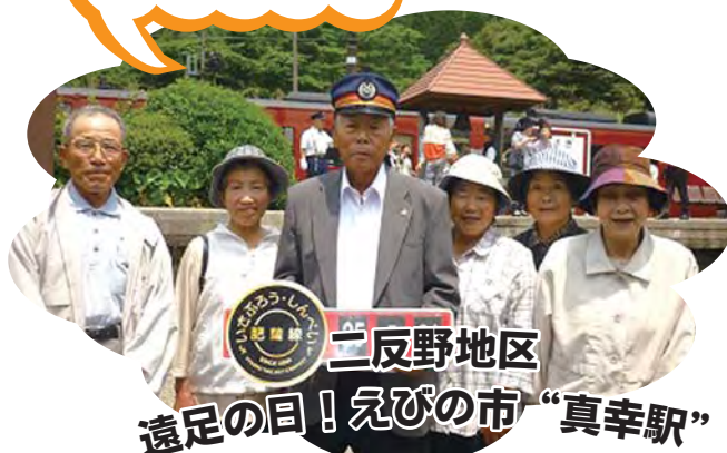
二反野地区 遠足の目! えびの市“真幸駅”