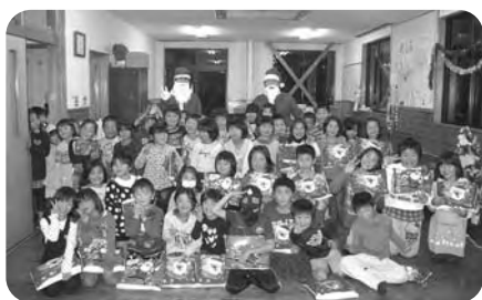
クリスマス会(綾町青年団のサンタさん)