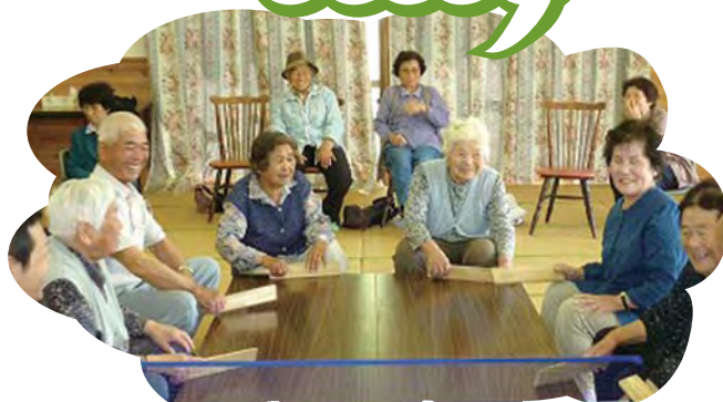
卓球バレー 大人気!!