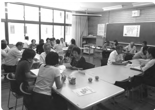
年間行事として、平成25年 7月22日 小・中学校の先生方との意見交換会の様子