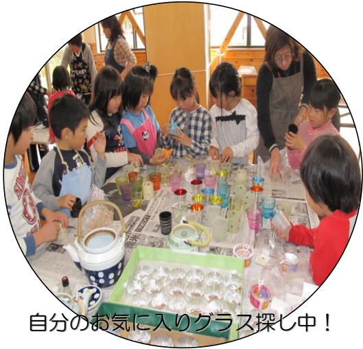
自分のお気に入りグラス探し中！