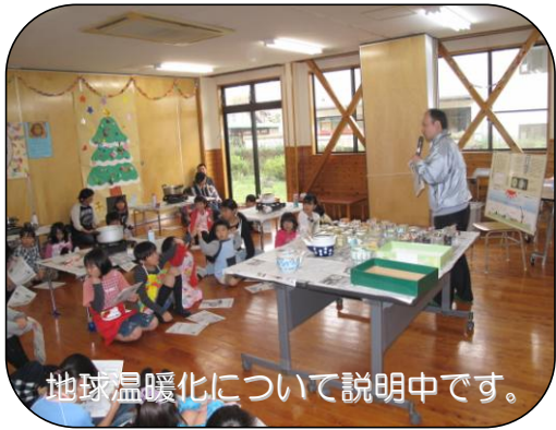
地球温暖化について説明中です。