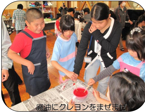
廃油にクレヨンをまぜまぜ