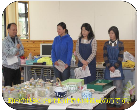
町内の地球温暖化防止活動推進員の方です。