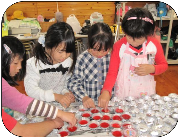
廃油が固まって、芯を真ん中にさしてみよう！