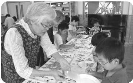
押し花で絵をかこう (イフツツジ会)

綾町児童館は、児童に健全な遊びを与えて、その健康を増進し、又は情操を豊かにすることを目的として平成11年4月開館、17年目を迎えています。綾小中学校より徒歩で数分、中央ふれあい公園に隣接と環境にも恵まれ、小学生を中心に1日平均98名、年間延べ2万6千人程の利用があり異年齢交流の場にもなっています。館内には遊戯室、集会室、図書室、調理室、児童クラブ室があり、全ての児童が気軽に利用でき、サッカー、一輪車、ドッジボールなどいろいろな遊びや、合同オセロ大会、合同プラバン工作など、児童館と児童クラブ児童の交流を目的とした合同の行事、各施設・団体との交流会、おもちゃ病院、詩吟教室他、さまざまな体験ができる「遊びの広場」です。利用は原則として無料です。