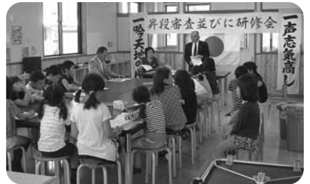
吟詠会の詩吟教室 (毎週土)