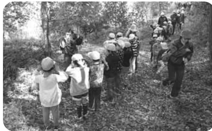
自然体験活動 (ネイチャージョゲーム)