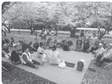
西都原古墳群へお花見ドライブ！