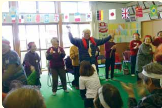
西中坪地区・東中坪地区：交流会を兼ねて、地区対抗のミニ運動会！！