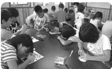
人気のプラバン工作