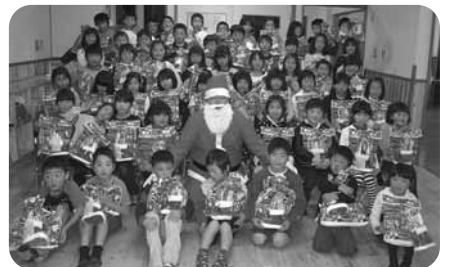
クリスマス会 (綾町青年団のサンタさん)