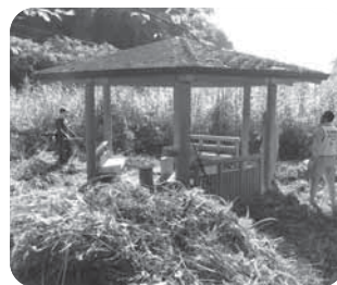
【森林セラピーロード】

「ボランティアをしたいけど保険は？」「ボランティアを受け入れたい」 お気軽にご相談ください。