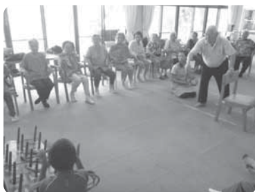
輪投げ！しっかりねらって！