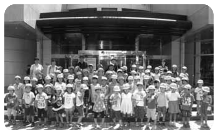
夏休み遠足 (宮崎科学技術館)