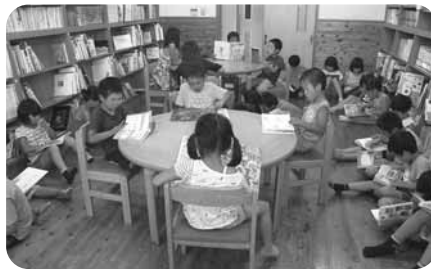
本を読もう! (図書室)