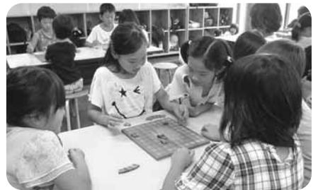
合同将棋すごろく大会