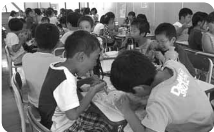
楽しいお弁当の時間です

児童館内に専用の児童クラブ室を設け、「放課後児童健全育成事業」を実施しています。小学校に就学している児童で、その保護者が仕事等により昼間家庭にいない児童に適切な遊び及び生活の場を与えて、その健全な育成を図ることを目的としています。綾町児童クラブは、綾小学校に在学する1年生から3年生の放課後児童を対象としています。 ※児童クラブ登録児童数：70名 (平成27年8月1日現在)