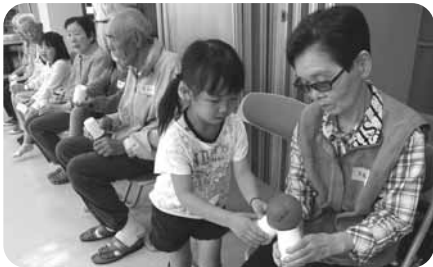
ケアハウスとの交流会 (ミニ運動会)