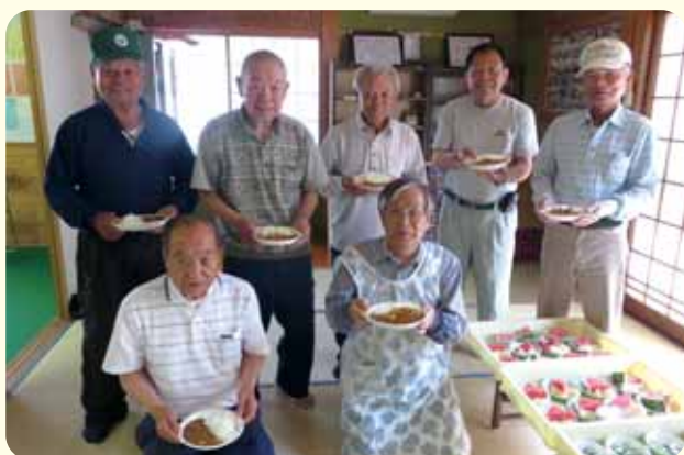
西中坪地区：『男の料理』男性参加者でカレーを作りました