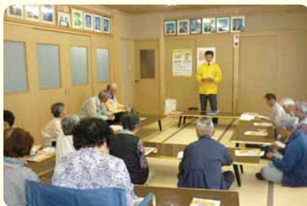
宮原地区：オレオレ詐欺について勉強しました。皆さん注意しましょう！