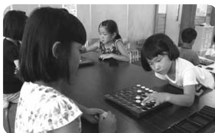
真剣です! (合同オセロ大会)