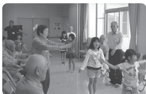
児童館とのミニ運動会