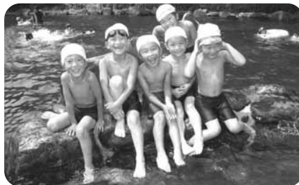
夏はプールが一番! (てるはの森の宿)