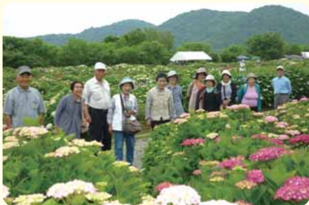
二反野地区：門川町『桃源郷』へ満開の“紫陽花”と一緒に！