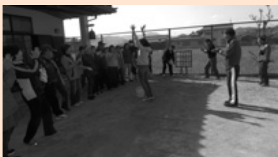
大人も無邪気にストラックアウト成功で大はしゃぎ

午後からは、老若男女入り交じってストラックアウトと全員参加のじゃんけん大会！大人も童心にかえって夢中になって遊びました。こども以上にはしゃいでいたかも？朝から夕方まで盛りだくさんのイベントで、大盛り上がりの楽しい一日となりました。