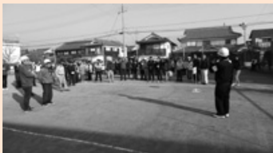
避難訓練！消防団が大活躍

午前中は“自律（立）のまちづくり事業”として、消防団の方にもきていただいて避難訓練とグランドゴルフ大会。お昼ご飯は、公民館にて三世世代間交流を目的に隣保ごとの食事会。お年寄りから子どもまで円になってお弁当を楽しみました。