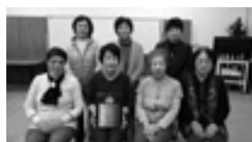
「福美会」メンバーの皆さま