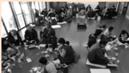
隣保ごとに親睦を深める食事会

午後からは、老若男女入り交じってストラックアウトと全員参加のじゃんけん大会！大人も童心にかえって夢中になって遊びました。こども以上にはしゃいでいたかも？朝から夕方まで盛りだくさんのイベントで、大盛り上がりの楽しい一日となりました。