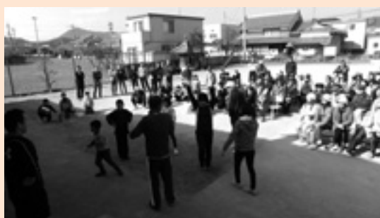
八反田のじゃんけんチャンピオン誕生