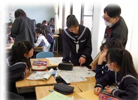
グループワークの様子