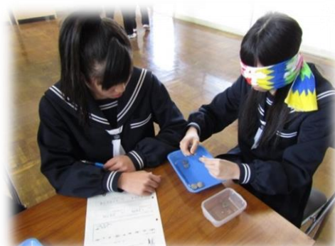
アイマスク体験の様子

今後も社会福祉協議会では、小中学校の福祉体験学習を通じて「みんなのしあわせ」を共に考え、実現に向けて考えるきっかけになるよう学習の支援をしていきたいと思ひます。