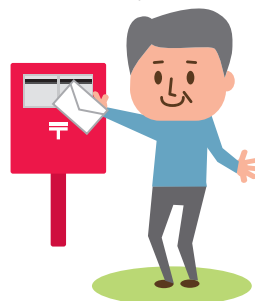
事務手続きの お手伝い