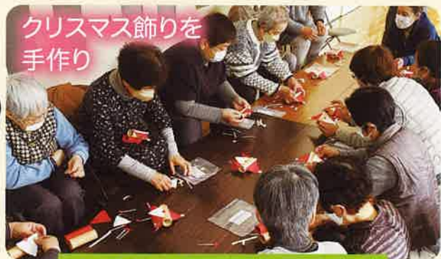
中組ふれあいいきいきサロン (伊岐津志)