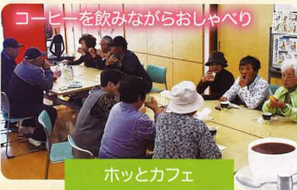
コーヒーを飲みながらおしゃべり