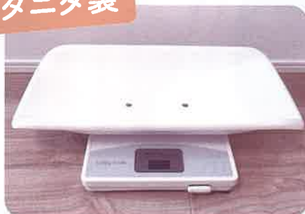
デジタルベビースケール