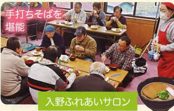
手打ちそばを堪能