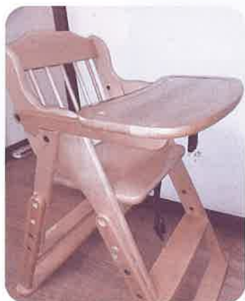
木製ベビーチェア

登録いただいているリユース品の情報を掲載します。譲り受け(無料)を希望する方は社会福祉協議会(担当:館林)までご連絡下さい。