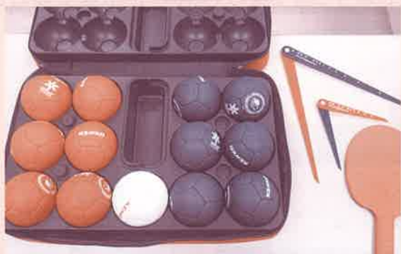
▲ボッチャ DXセット(1式)