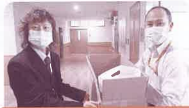
特別養護老人ホーム 敬和園