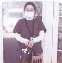
リハビリデイサービス 紙ひこうき