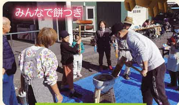
上牧野いきいきサロン