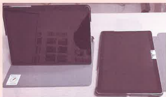
▲タブレット端末(2台)・保護カバー(2個)