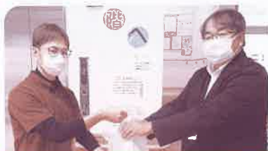
ありがとうサン八百津

11月1日から12月8日の期間、町内の社会福祉法人・施設と協力連携して、家庭で使わない食品を集め、生活困窮世帯等へ提供する八百津町フードバンク(ドライブ)キャンペーンを実施しました。