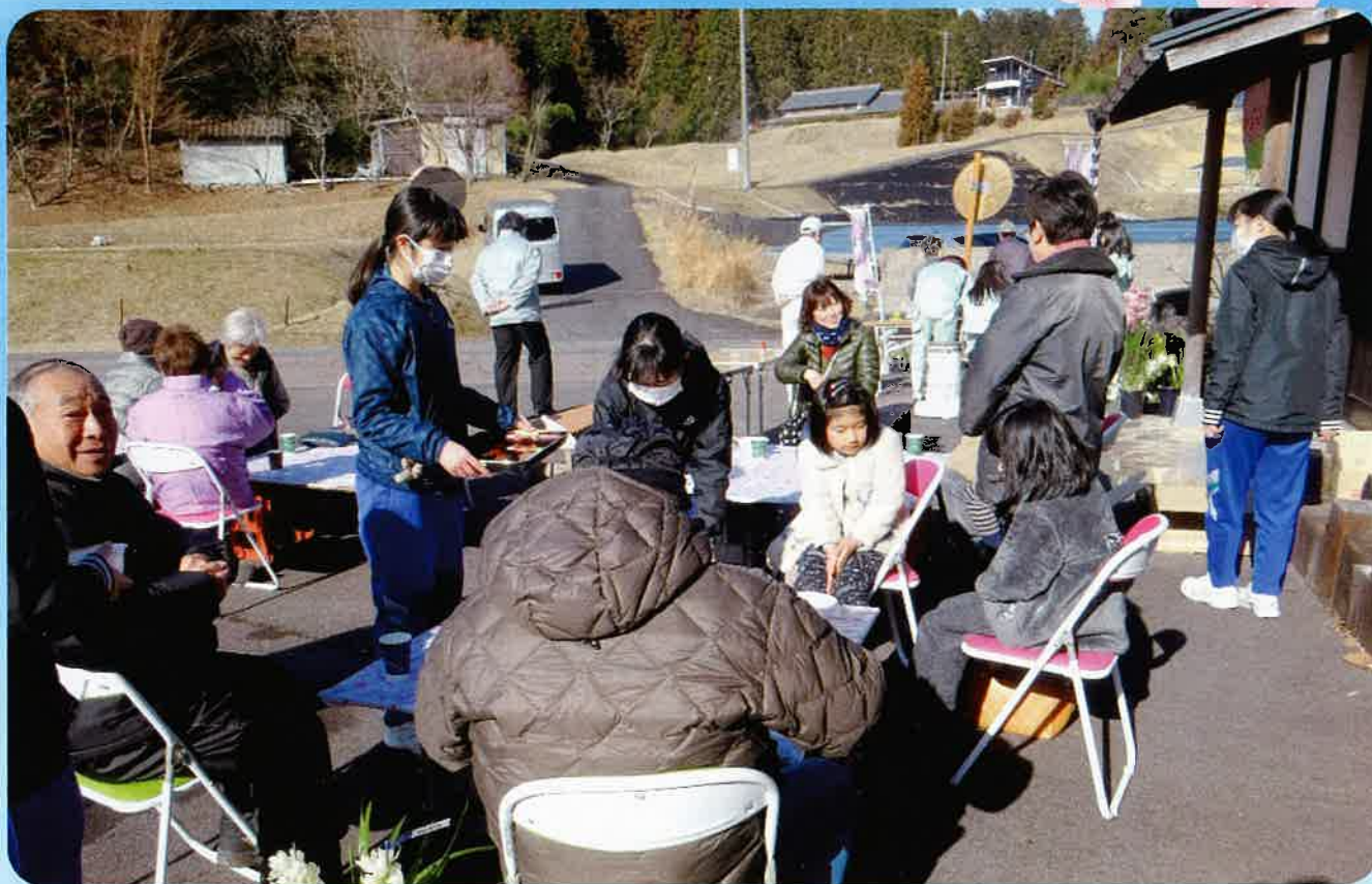
憩いの場「くたみん」で芋煮会を開催しました