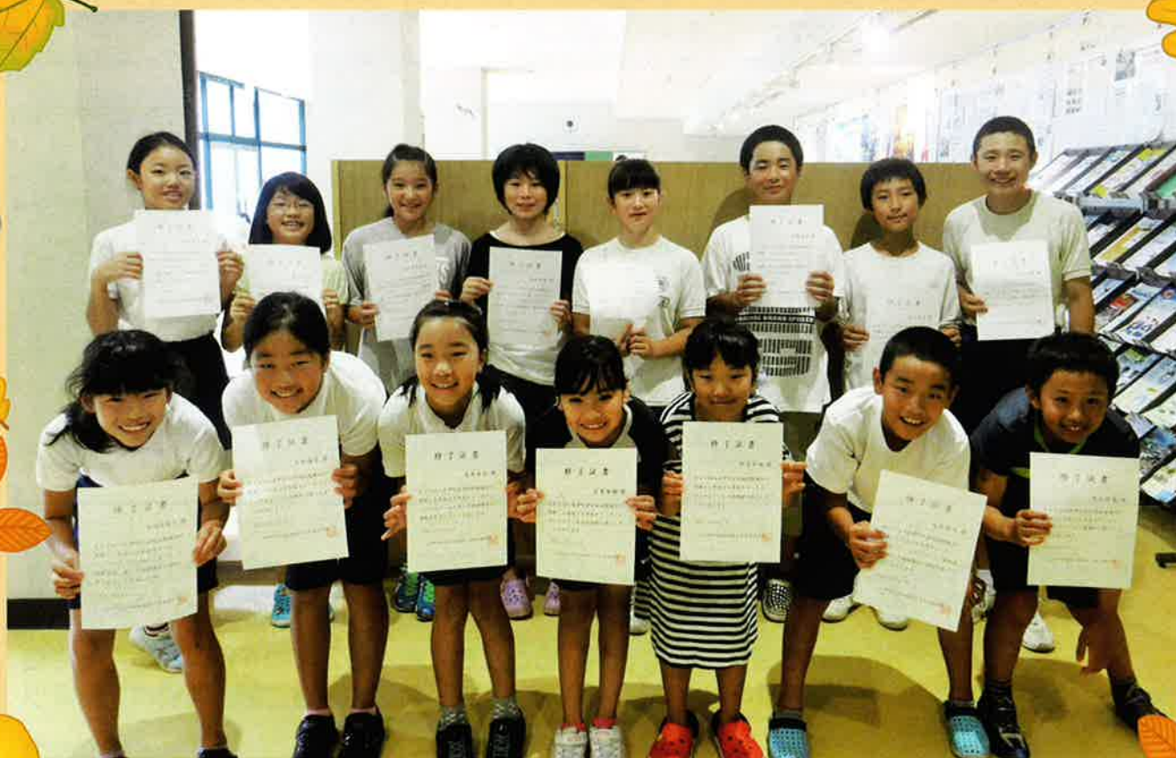
サマーボランティアスクール参加者の皆さん