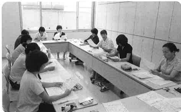
介護職員は定期的にミーティングや研修を行い、提供するサービスの質の向上に努めています。