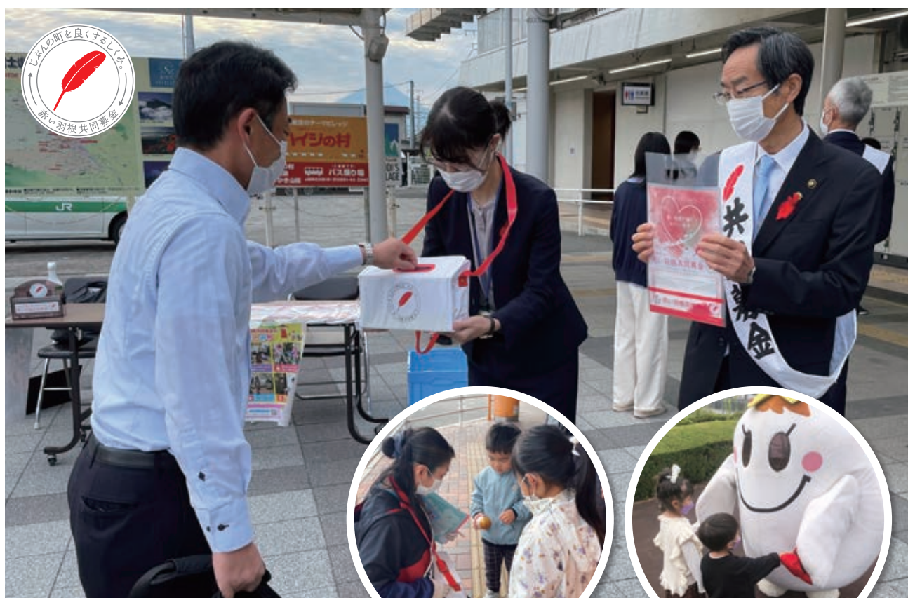
赤い羽根共同募金 街頭募金運動