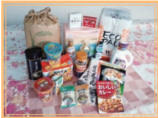
お渡しする物品の一例です