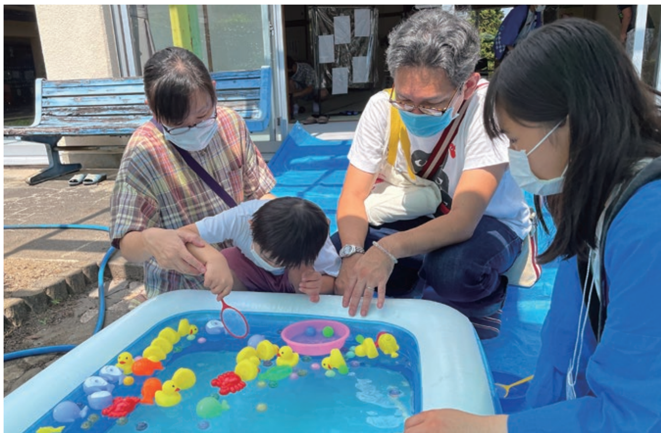
在宅障がい児(者)母子グループ等療育指導事業「夏まつり」