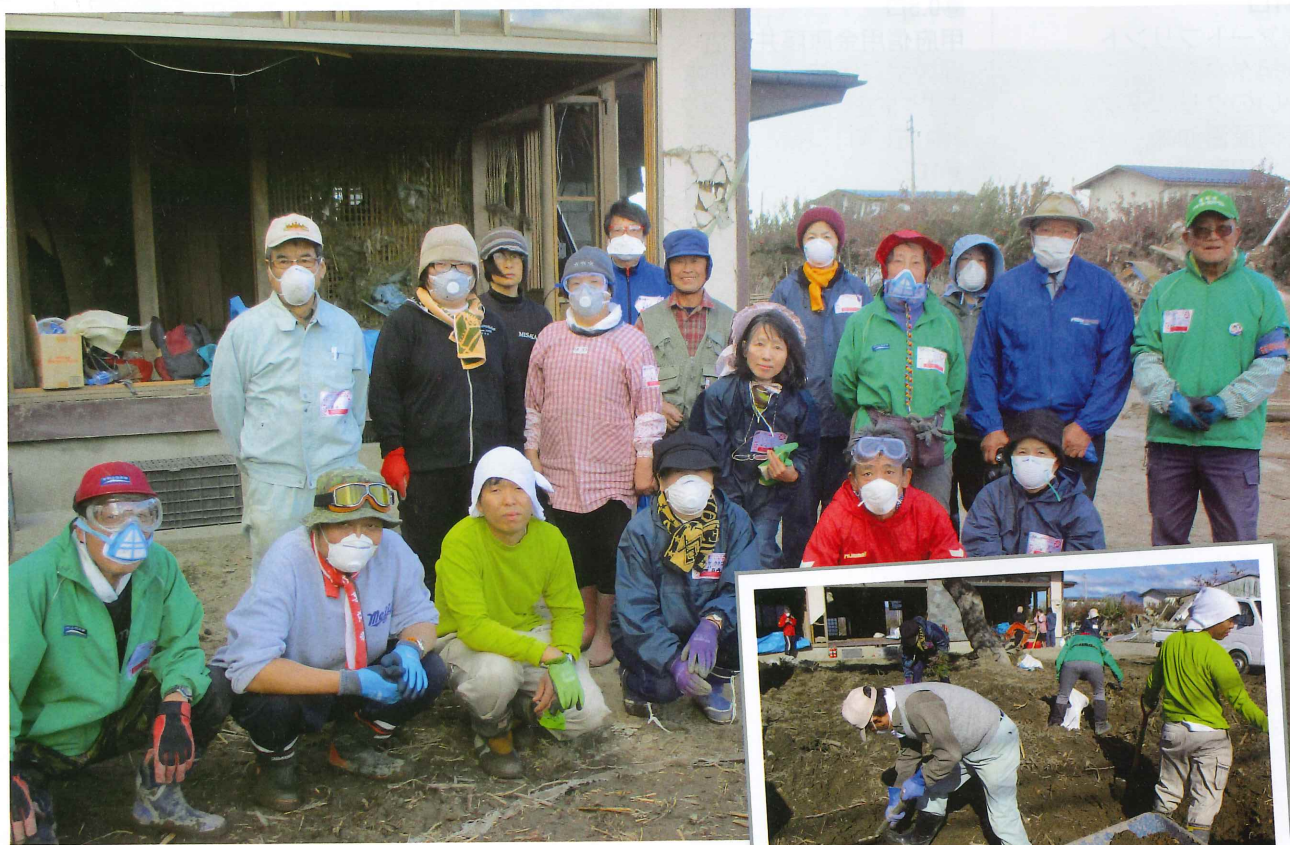
韮崎社協災害ボランティア活動【長野県長野市】