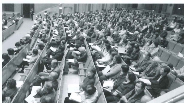
当日の会場の様子