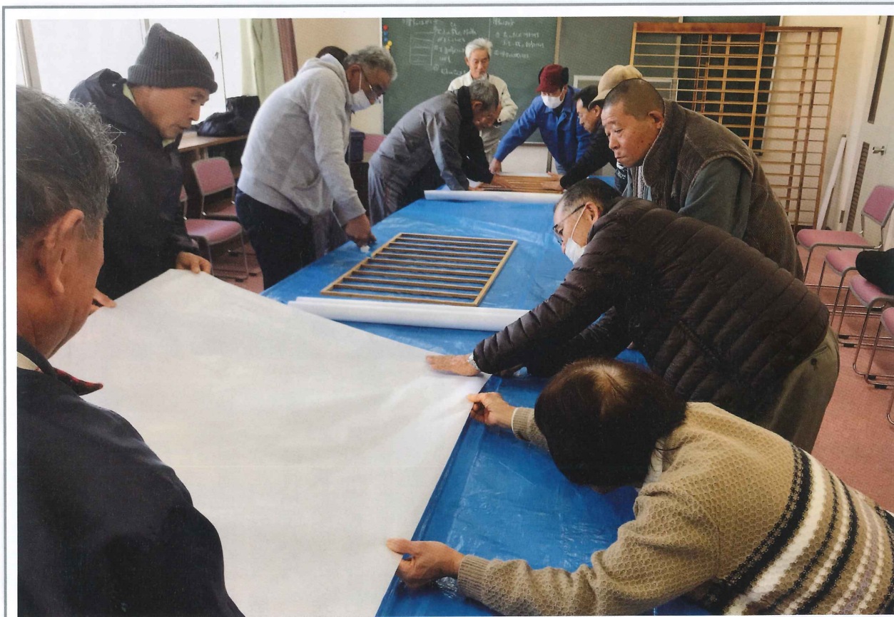
技能習得ボランティア講座