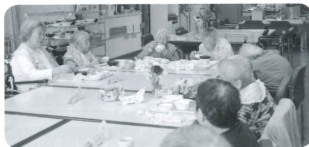
ほっぺたが落ちるような温かくて美味しい昼食