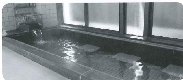
見守りの中で安心して入れる天然かけ流しの温泉