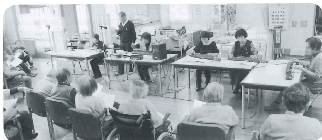
大正琴の音色に聴き惚れました