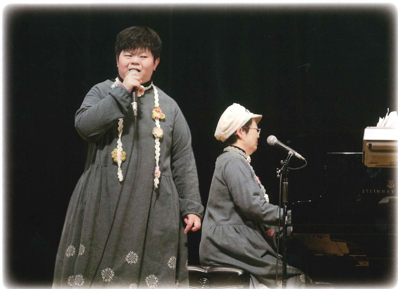
荳崎市社会福祉大会での親子アンサンブル（マリナーズ）