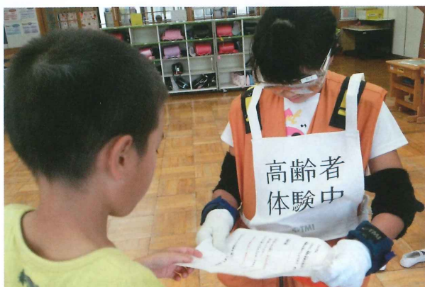
高齢者疑似体験の様子

社協では、地域福祉活動及び福祉学習の推進を目的に保有している備品を貸し出します。