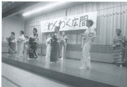
■ 9月27日 舞踊披露