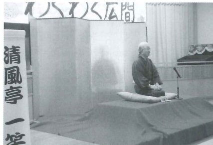
■ 7月22日 落語