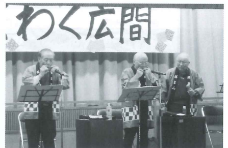
■ 11月25日 ハーモニカ演奏会