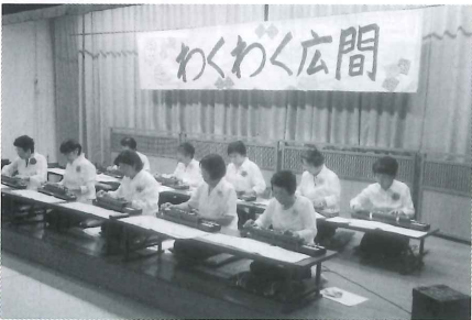
■ 9月13日 大正琴演奏会