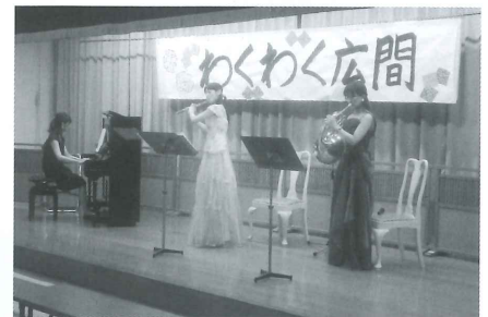
■ 8月25日 ura*cocoコンサート