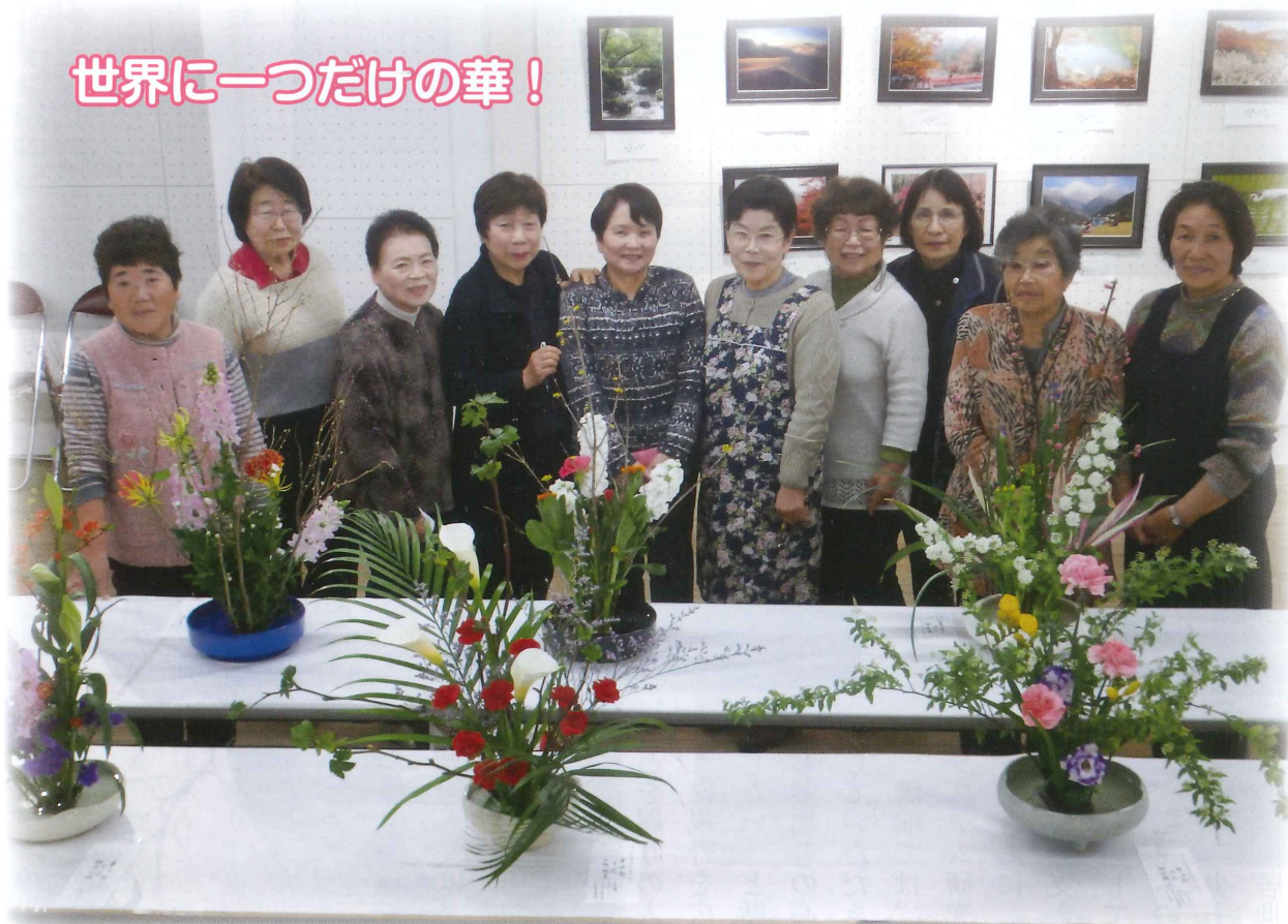
韮崎市老壮大学文化祭