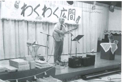
■ 12月20日 フォークソングクリスマス会