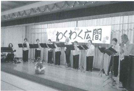
■ 6月2日 オカリナ演奏会