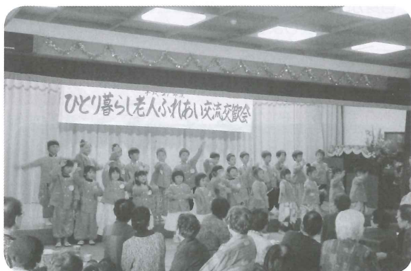
ひとり暮らし高齢者の交流会