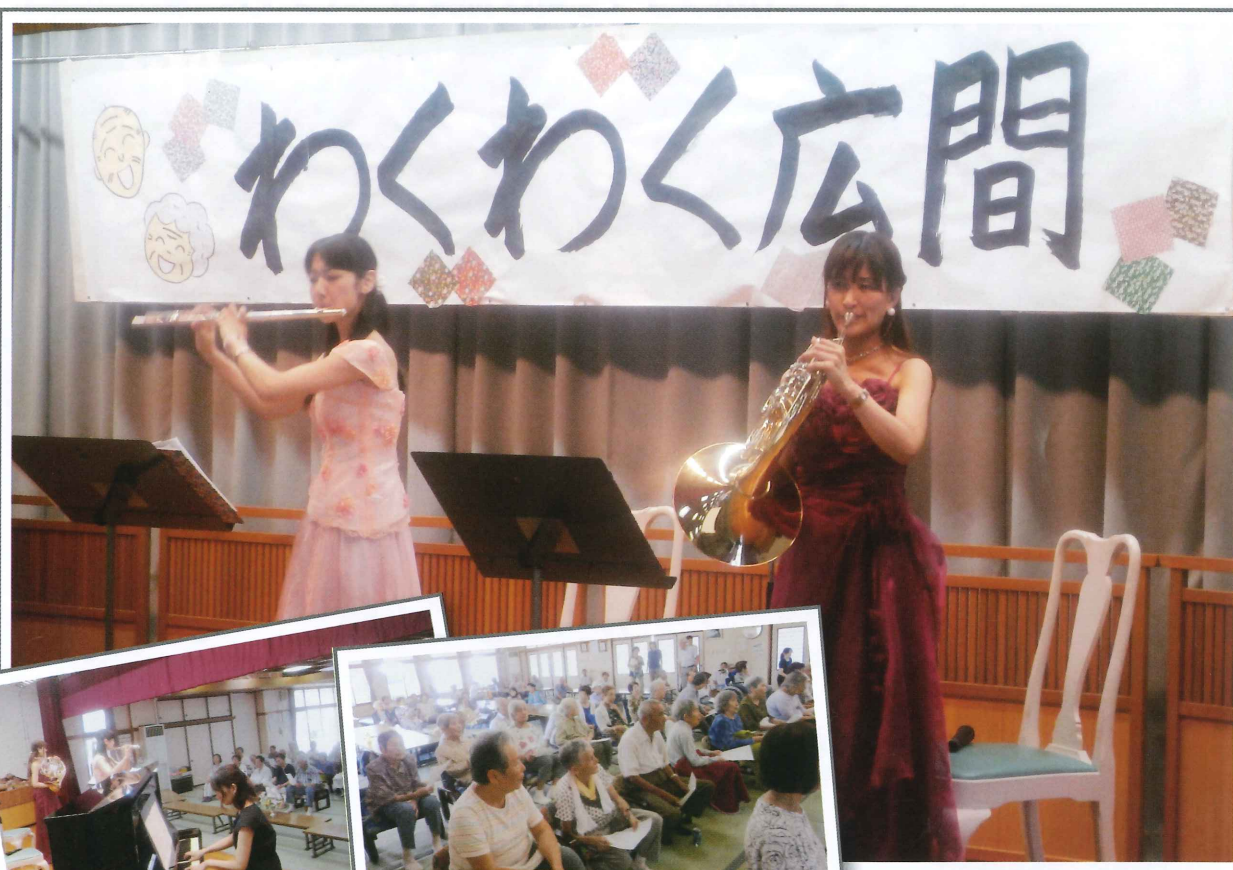
「ura*coco コンサート」 荳崎市老人福祉センターにて (東京エレクトロン荳崎文化ホールアウトリーチ事業)