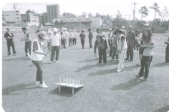
障がい者交流運動会