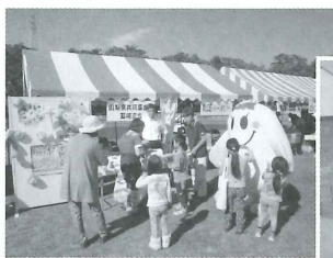
武田の里にらさきふるさとまつり、荏崎市福祉の日記念まつりなどの街頭募金では学生ボランティアさんや道化師が協力してくれました。