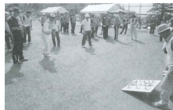
障がい者交流運動会が開催されました。