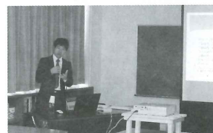
「私たちのボランティア」学習会