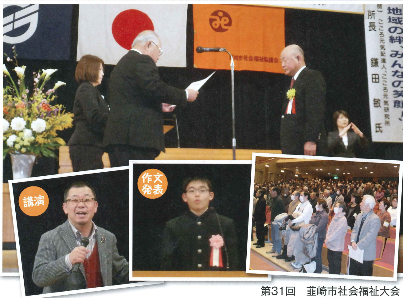
第31回 葦崎市社会福祉大会