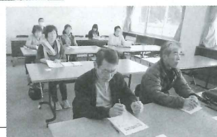
「葦崎市のボランティアについて」学習会