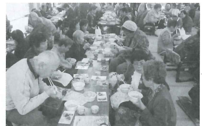
ひとり暮らし老人ふれあい交流交歓会に87名が参加されました。