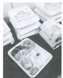
食事サービス 毎週水曜日、ボランティアさんの協力で高齢者や障がいのある方などにお弁当が調理・配達されました。