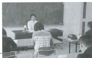
「今後ボランティアに求められること」学習会