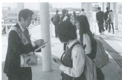
10月1日 JR 荏崎駅にてオープニングセレモニー及び街頭募金を実施