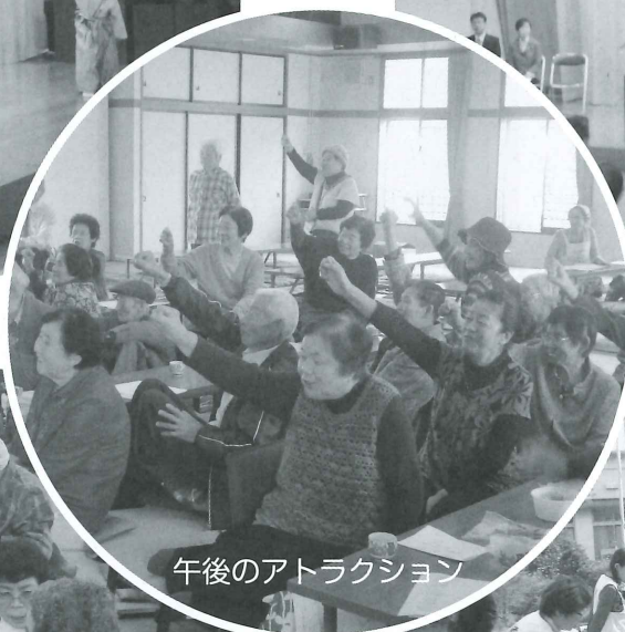
午後のアトラクション