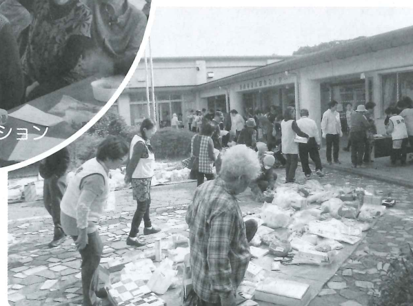
招待者優先バザー

10月30日(金)に老人福祉センターにおいて、市内で生活している70歳以上のひとり暮らしの方々をお招きして「ひとり暮らし老人ふれあい交流交歓会」を開催しました。