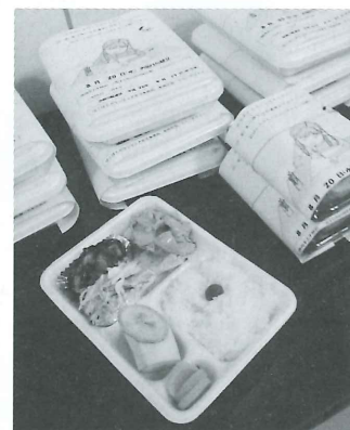
社協が行う食事サービス