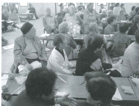
ひとり暮らし高齢者の交流会