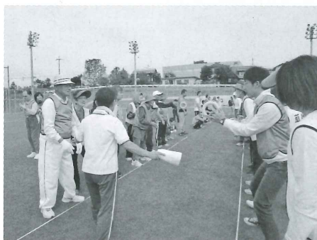
障がい者交流運動会