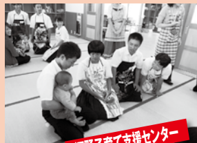
河野子育て支援センター

乳児もお兄さん、お姉さんに抱っこされたり、頬や頭をなでられ、とてもご機嫌でした。