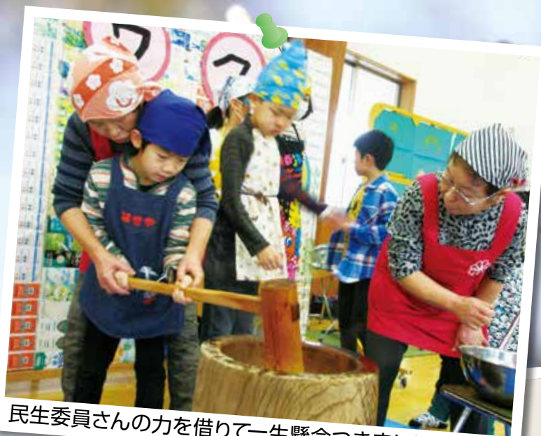
民生委員さんの力を借りて一生懸命つきました。