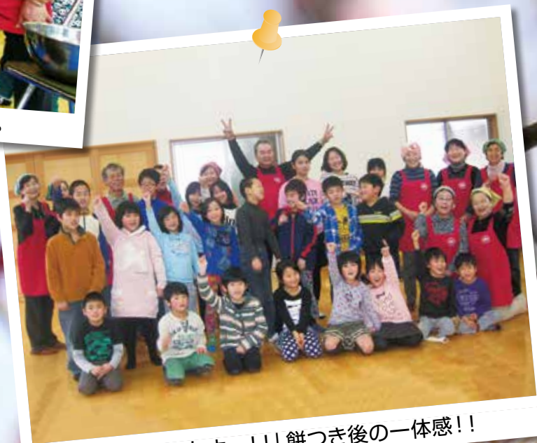
「お餅おいしかったよー!!」餅つき後の一体感!!

河野地区民生児童委員協議会の皆さんと河野児童館利用児童との餅つき大会が行われました。