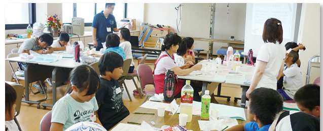
8/5(火) 河野保健福祉センター…22名参加 ボランティアあなたならどちらを選ぶ?