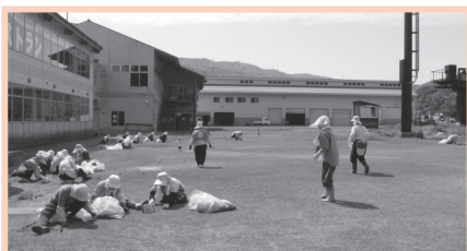
5月20日(火)今庄365スキー場にて