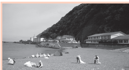
7月6日(日)河野・甲楽城・糠海水浴場にて