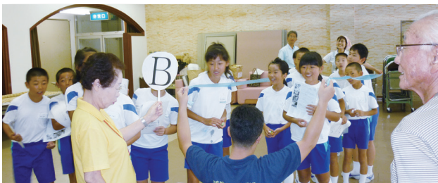
8/4(月) 今庄保健センター…26名参加 ボランティアクイズに挑戦

自発性 自分から進んで行動する 社会性 共に支えあい、学び合う 無償性 見返りを求めない 開発性 より良い社会をつくる