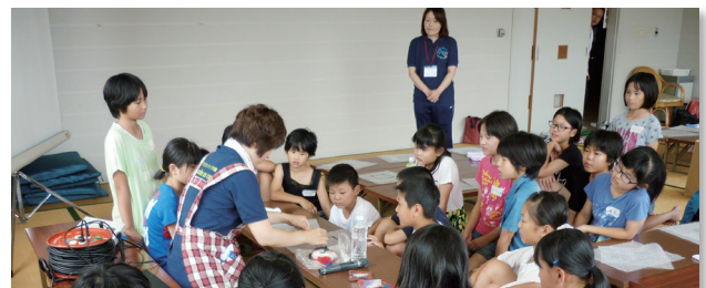
8/7(木) 南条保健福祉センター…26名参加 羊毛でコースター作り