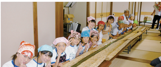
8/6(水) 湯尾ふれあい会館…21名参加 地域の皆さんとロング巻き寿司で一体感