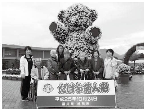
河野デイサービス