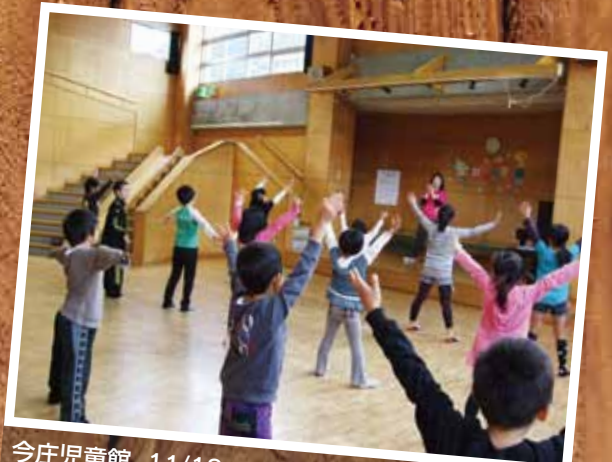
今庄児童館 11/18 楽しく元気にダンスに挑戦!たくさん体を動かしました。