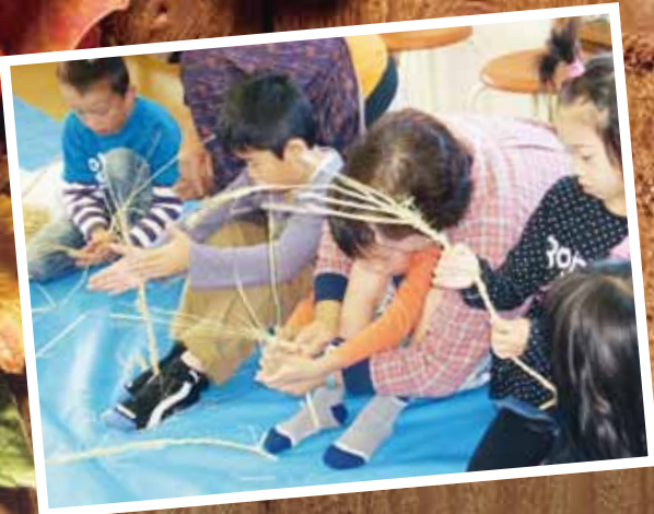
南条児童館 10/28 シルバー人材センターの会員さんから、わらそうりの 作り方を教わりました。