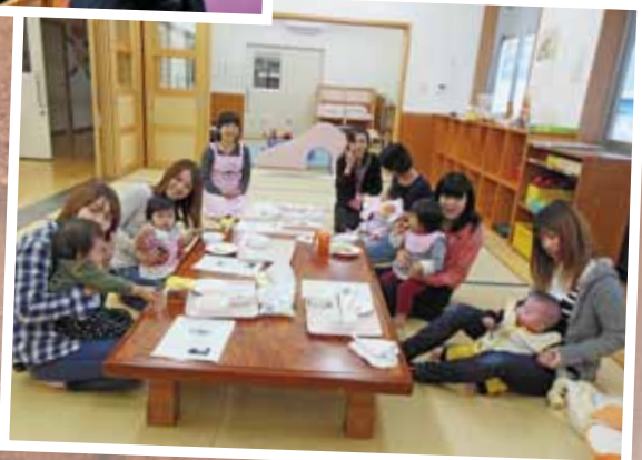
河野子育て支援センター 11/12 手作りのおやつは、赤ちゃんも大喜び。おいしくい ただきました!