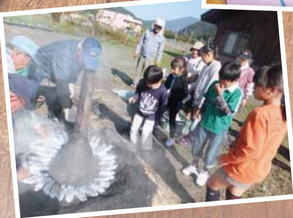
湯尾児童館 10/28 秋晴れの中、湯尾長寿会のみなさんと焼き芋を 作りました。