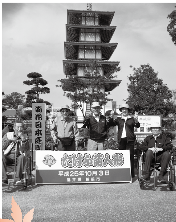
今庄デイサービス