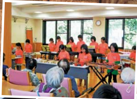
河野児童館 9/30 河野デイサービスセンター と民生児童委員さんとの 交流会で、わくわくバンドの 披露をしました。