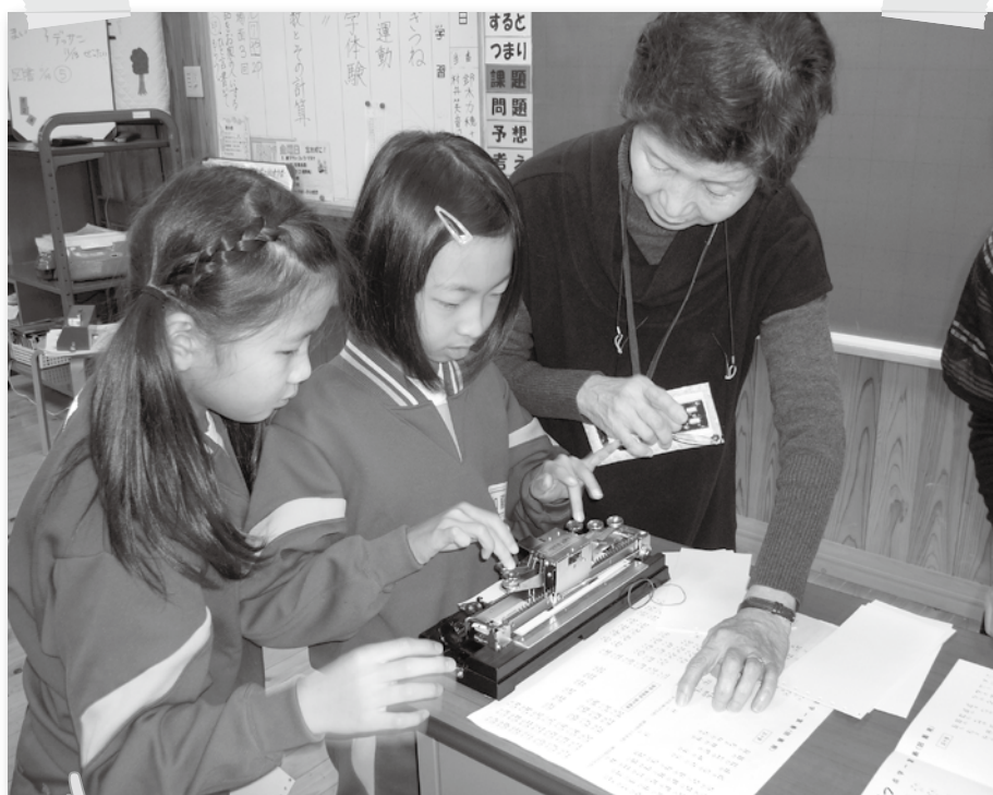
点字用具を使つての打点体験