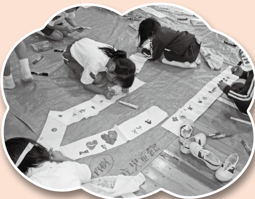
思い思いの絵を描いている様子