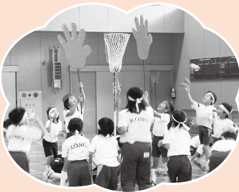
「玉入れ」ではなく「玉入れさせない」競技の様子

競技内容は、児童館ならではの遊びを工夫した競技ばかりで、子ども達は普段とは違う種目に戸惑いながらもチーム内で協力しながら最後までがんばっていました。