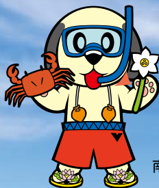
南越前町ランティー