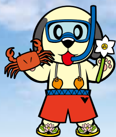
南越前町ランティー