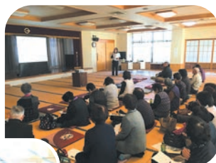
手当の基本を学びました