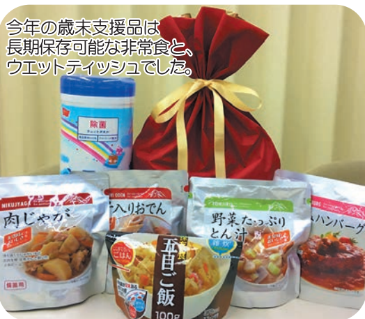
今年の歳末支援品は長期保存可能な非常食とウエットティッシュでした。

ご協力ありがとうございました 共同募金・歳末たすけあい募金 毎年町民の皆さまをはじめ、各学校、団体、企業の皆さま方には本募金の趣旨をご理解いただき特段のご協力を賜り厚くお礼申し上げます。 また、募金活動にご協力いただきました各関係者の皆さま方にも深く感謝いたします。 共同募金1,326,000円、歳末たすけあい募金393,000円が集まりました。 共同募金は、県共同募金会へ送金したのち、来年度町へ配分され地域福祉のために活用されます。 歳末たすけあい募金は、昨年末に町社会福祉協議会事業の歳末たすけあい義援金・支援品として支援を必要とする方々に配分されました。