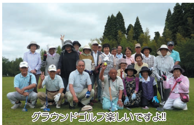
グラウンドゴルフ楽しいですよ!!