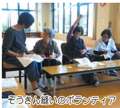
ぞうきん縫いのボランティア