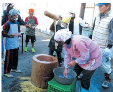
美味しいお餅をつくるぞ～！

自分たちで作った、つきたてのお餅を醤油やきなこ、あんこで美味しそうに食べている姿が、とても印象的でした。