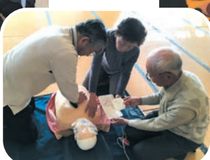
胸骨圧迫は「強く、速く、絶え間なく」