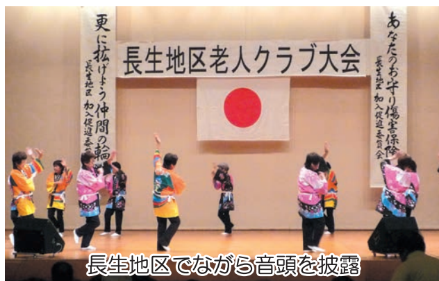
長生地区でながら音頭を披露