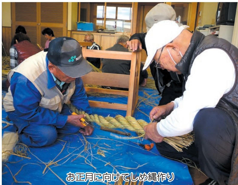
お正月に向けてしめ縄作り