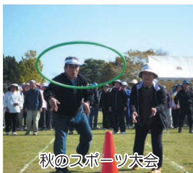
秋のスポーツ大会