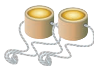
上手に歩けるかな？

竹ぼっくりは歩く度に、”ぼっくり”と音を立て、体育館には軽快な音と児童の笑い声が響いていました。