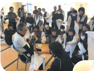
三角巾でやけどの手当

災害はいつどこでも起こる可能性はあるという認識を持ち、日頃より備えのある活動ができるボランティアを目指して、今後も講習会を開催する予定です。