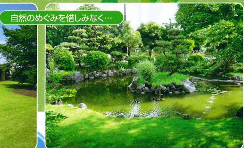
自然のめぐみを惜しみなく…