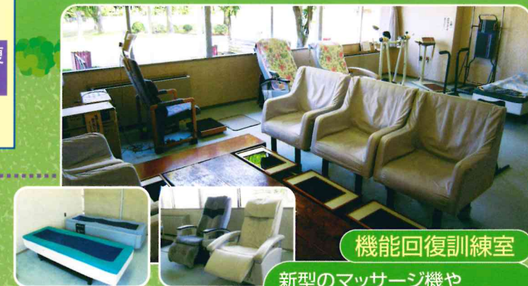
機能回復訓練室 新型のマッサージ機や 血流促進のヘルストロンなど