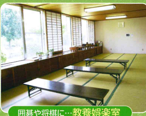
囲碁や将棋に… 教養娯楽室