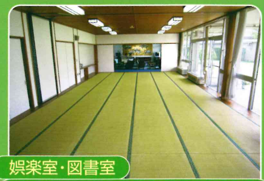
娯楽室・図書室 大小の宴会や会議のほか様々な催し物にご利用いただけます。