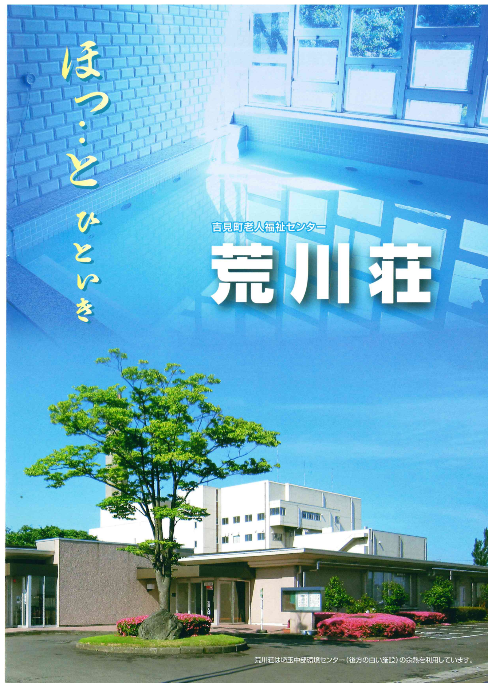
荒川荘は埼玉中部環境センター(後方の白い施設)の余熱を利用しています。