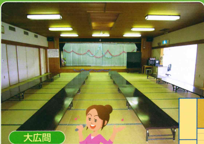
大広間 最新の通信カラオケをお楽しみいただけます。