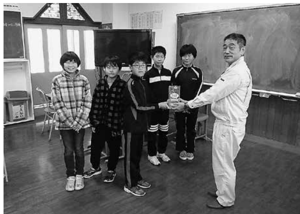
南が丘小学校児童会の皆様

平成二十九年度「赤い羽根共同募金運動」に皆様からたくさん募金が集まりました。 ありがとうございます!!