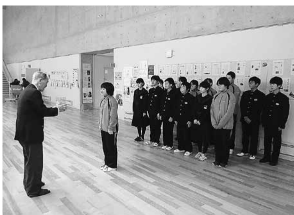
江差中学校広報専門員委員会の皆様