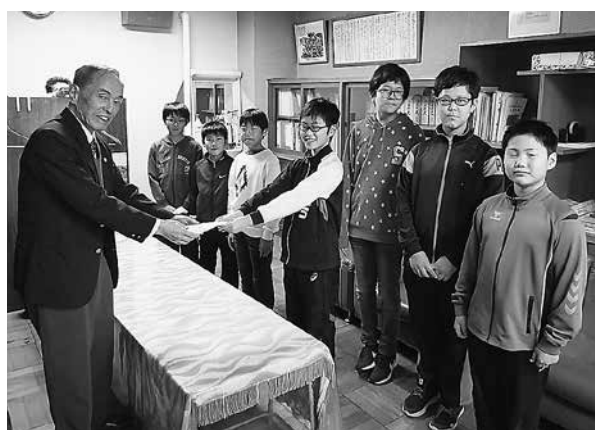
江差小学校代表委員会の皆様