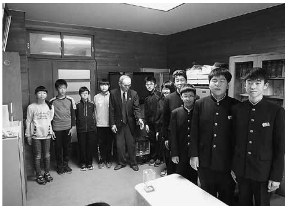
江差北小学校児童会・江差北中学校生徒会の皆様