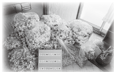
茂尻町子供会の皆さまより