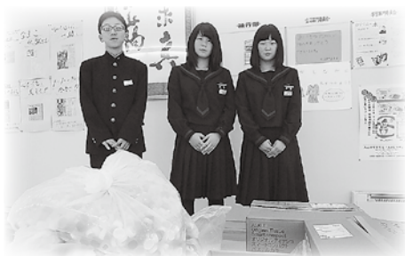
江差中学校広報専門委員会の皆さまより