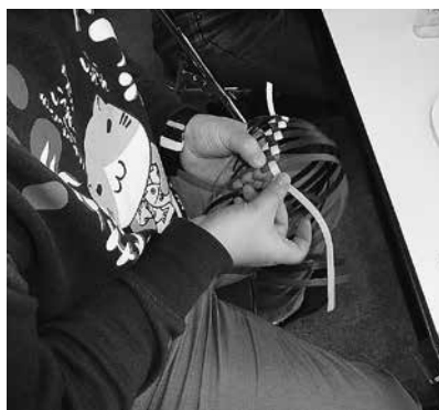
クラフト・ペーパーの鍋敷き作成中