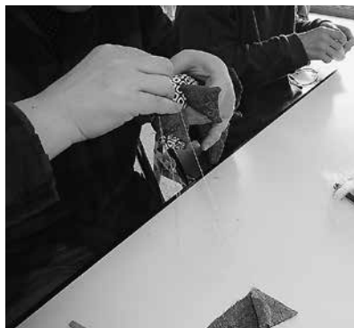
吊るし飾り作成中