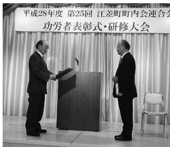
江差町町内会連合会功労者表彰