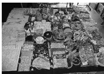
江差町老人福祉センター内で、 常時、展示・販売しています