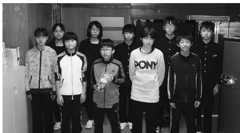
江差北中学校生徒会(当時)・江差北小学校児童会(当時)の皆様から、街頭活動と校内で集まった赤い羽根共同募金を平成 28 年 11 月 15 日にお預かりいたしました。