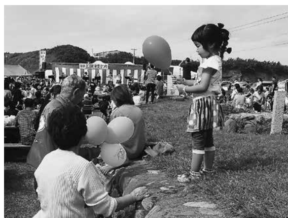
第 38 回江差町産業祭りでの街頭募金の様子 赤い羽根共同募金のロゴ入り風船を配りながら、皆様に協力をお願いいたしました。