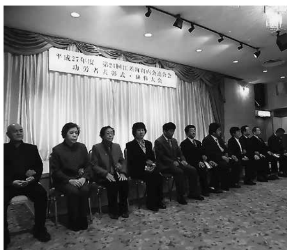
江差町町内会連合会功労者表彰受賞者（出席者）の皆様