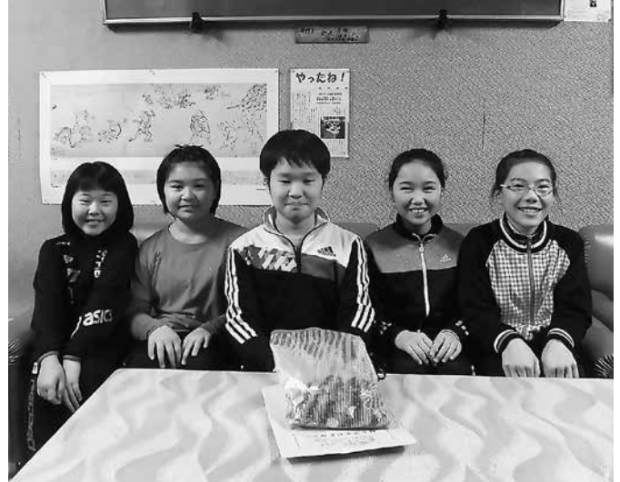
江差小学校代表委員会の皆様