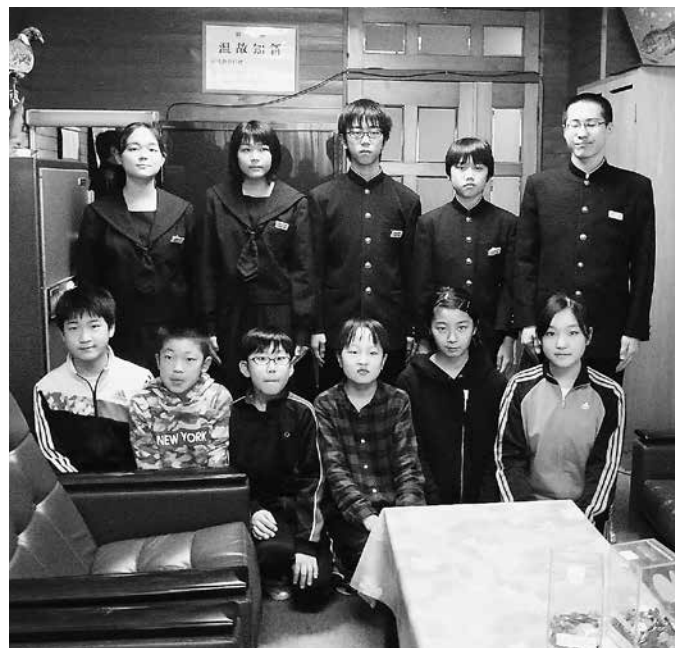
江差北小学校児童会・江差北中学校生徒会の皆様