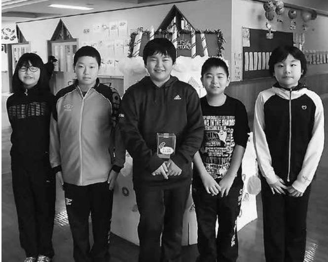
南が丘小学校児童会の皆様

発行 社会福祉法人 江差町社会福祉協議会 〒043-0032 江差町字新栄町264-2(江差町老人福祉センター内) TEL 0139-52-2441 FAX 0139-52-0560 ホームページ http://www.shakyo.or.jp/hp/48/