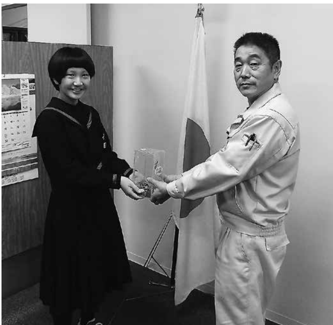
江差中学校広報専門委員会委員長様