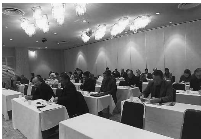
開会前の会場の様子