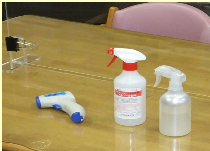
▲非接触型体温計による検温と、こまめな消毒作業を 毎日定期的に実施しています。