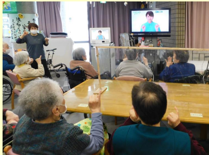
▲新たにレクリエーション機材を導入しました♪ 日々の機能訓練や認知機能維持に活躍中！！