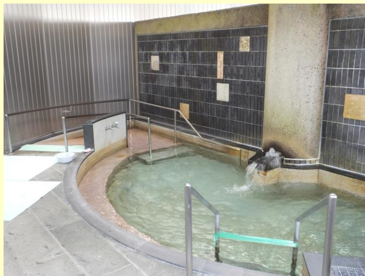
▲中新田デイの『イチオシ』大浴場（一般浴室）！ 大きなお風呂で手足を伸ばして温泉気分♫