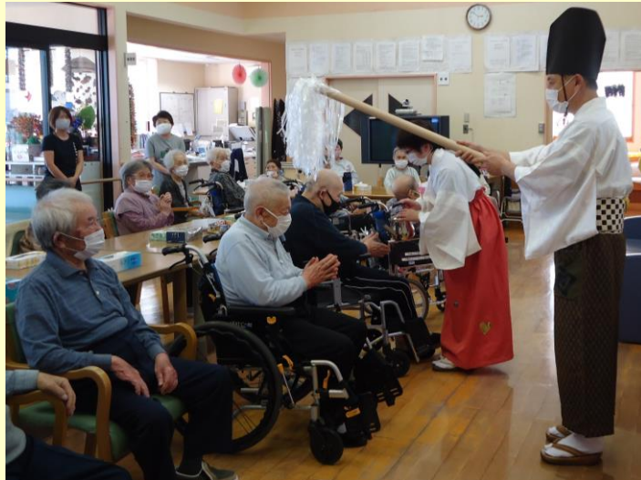
▲季節ごとの行事もいっぱい！職員も盛り上げます！ この日は神主さん登場！いいことがありますように♪