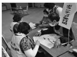
ボランティア育成