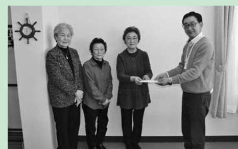
階上町連合婦人会 様

町老人クラブ連合会では、いきいき健康階上クラブを愛称に随時会員を募集しています。60歳以上の方であればどなたでも入会できますのでお気軽に社協までご連絡ください。