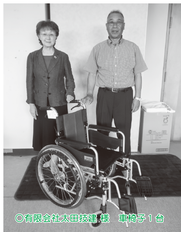
○有限会社太田技建様 車椅子1台