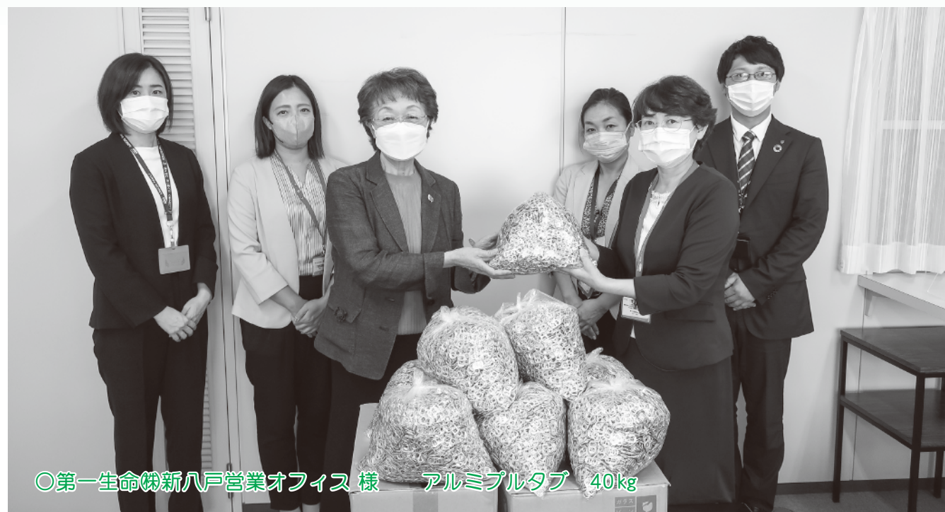
○第一生命㈱新八戸営業オフィス様 アルミプラタブ 40kg