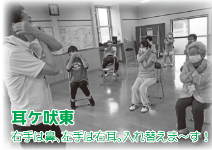
耳ヶ吠東 右手は鼻、左手は右耳。入れ替えま〜す！