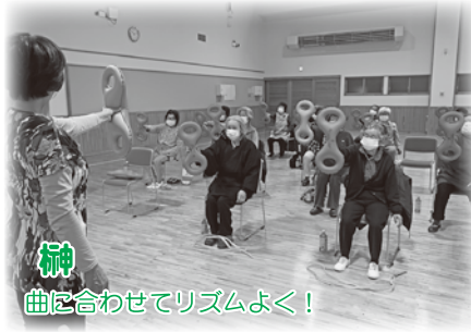
神 曲に合わせてリズムよく！