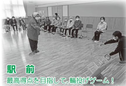
駅前 最高得点を目指して、輪投げゲーム！