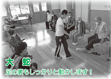
大蛇 足の裏もしっかりと動かします！