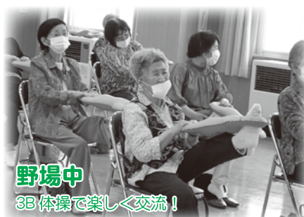
野場中 3B体操で楽しく交流！