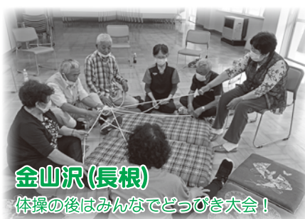
金山沢(長根) 体操の後はみんなでどっぴき大会！