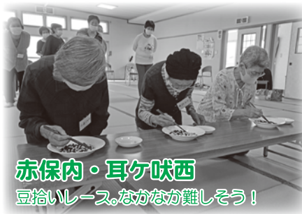
赤保内・耳ヶ吠西 豆拾いレース。なかなか難しそう！