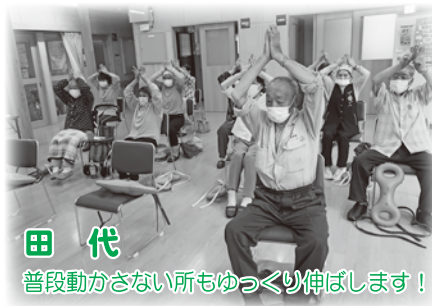
田代 普段動かない所もゆっくり伸ばします！