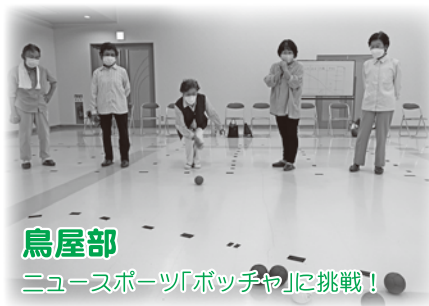
鳥屋部 ニュースポーツ「ポッチャ」に挑戦！