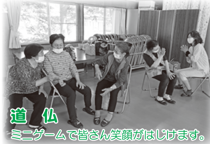
道仏 ミニゲームで皆さん笑顔がはじけます。