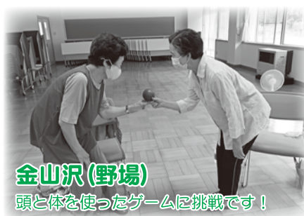
金山沢(野場) 頭と体を使ったゲームに挑戦です！