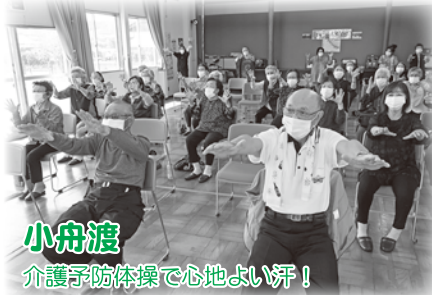
小舟渡 介護予防体操で心地よい汗！