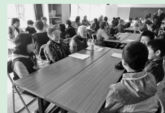
石鉢小学校児童と交流会、授業参観など