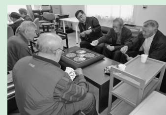
トランプ、会食交流など