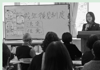
人権擁護委員による講話、ゲーム、買物など