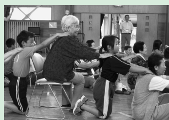
階上小学校児童と交流会、給食交流など