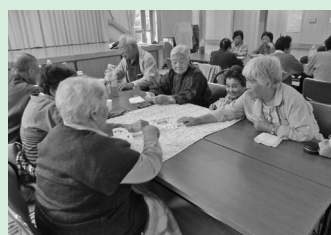
体力測定、トランプ、会食交流など