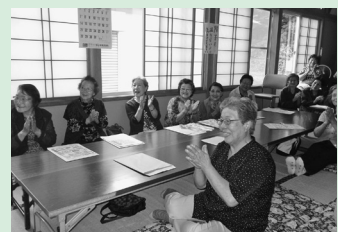
階上交番講話・寸劇、会食交流など