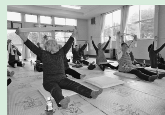
健康体操、ゲーム、会食交流など