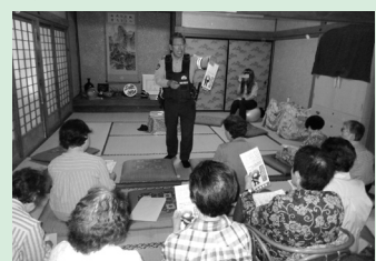
階上交番講話・寸劇、会食交流など