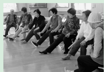
健康体操、会食交流など