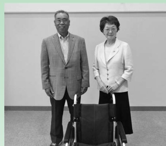
○有限会社太田技建 様 車椅子1台