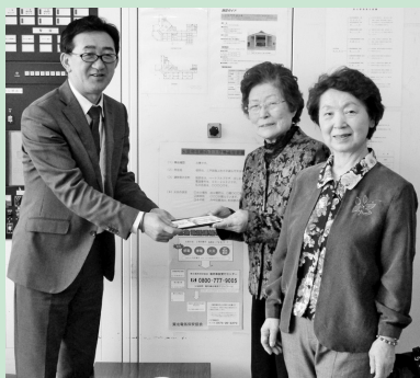
花美流舞会 花美律舞鳳 様