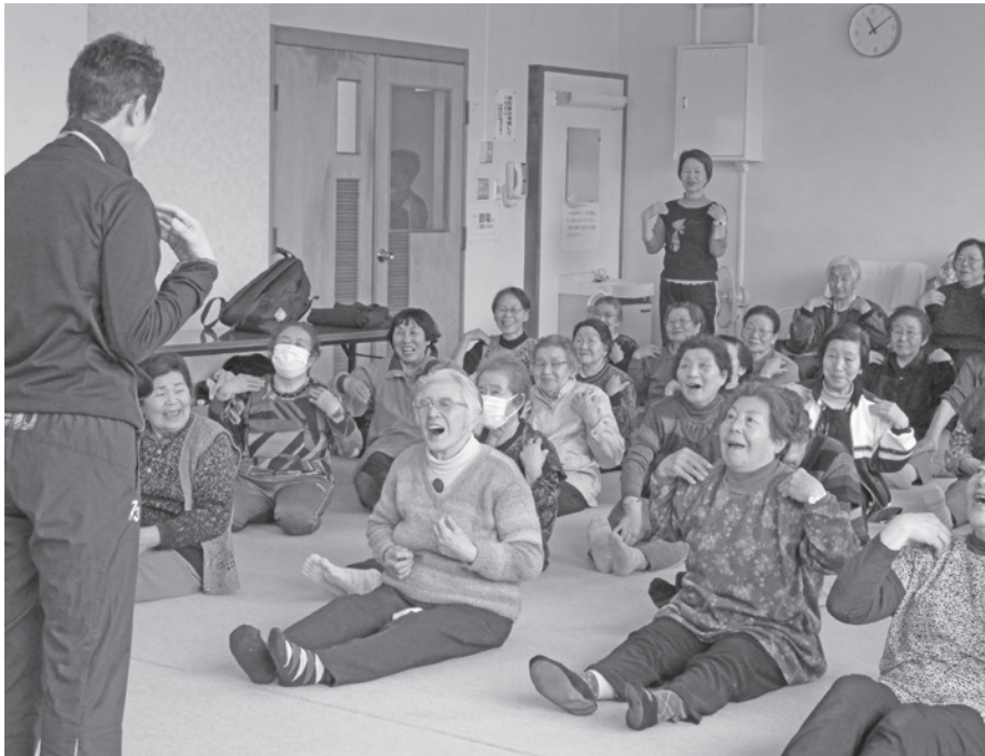
いきいき体操教室