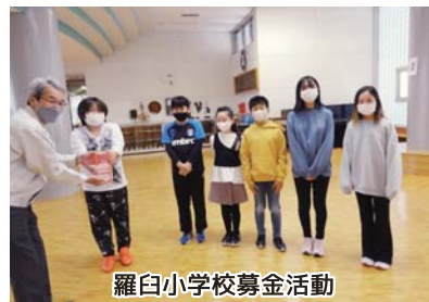
羅臼小学校募金活動