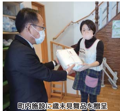
町内施設に歳末見舞品を贈呈