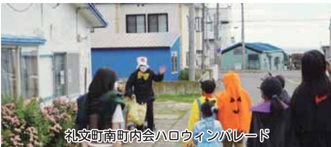
礼文町南町内会ハロウィンパレード

小地域福祉活動3町内に助成 子育て支援事業所クリスマス訪問（3カ所） 入学祝い品贈呈事業の実施：町内小学校 福祉団体への助成：各種団体7団体に助成 地域サロン開設（6月～3月）