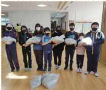
春松小学校環境委員会 様