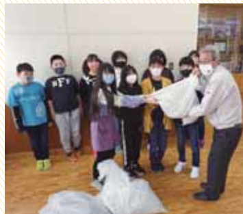
羅臼小学校ボランティア委員会 様