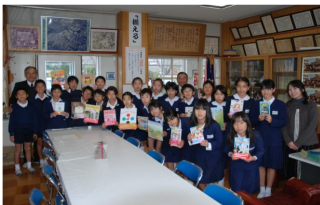
始良市立柁城小学校 図書委員のみなさん

読書を通じて児童生徒が感情や情緒を豊かに育み、創造的で個性的な心の働きを養ってもらうことを目的に、始良市内の小・中・高等学校、養護学校に希望図書を募り、合計326冊の図書を寄贈しました。