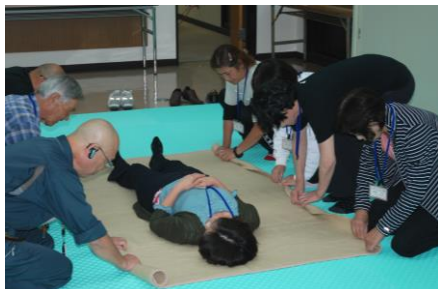
写真上：救急法 写真下：図上訓練

防火の予備知識やボランティアとして活躍するための技術を身につけようと7名の方が参加しました。講座では、炊き出し訓練や救急法、始良市の防災、DIG(図上訓練)などを実施しました。