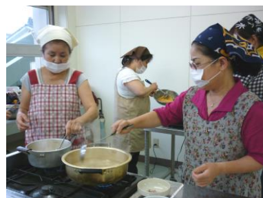
(おやつ作り体験の様子) トマトジュースやかぼちゃ、プロセスチーズを使った「夏野菜のホットケーキ」を作りました。